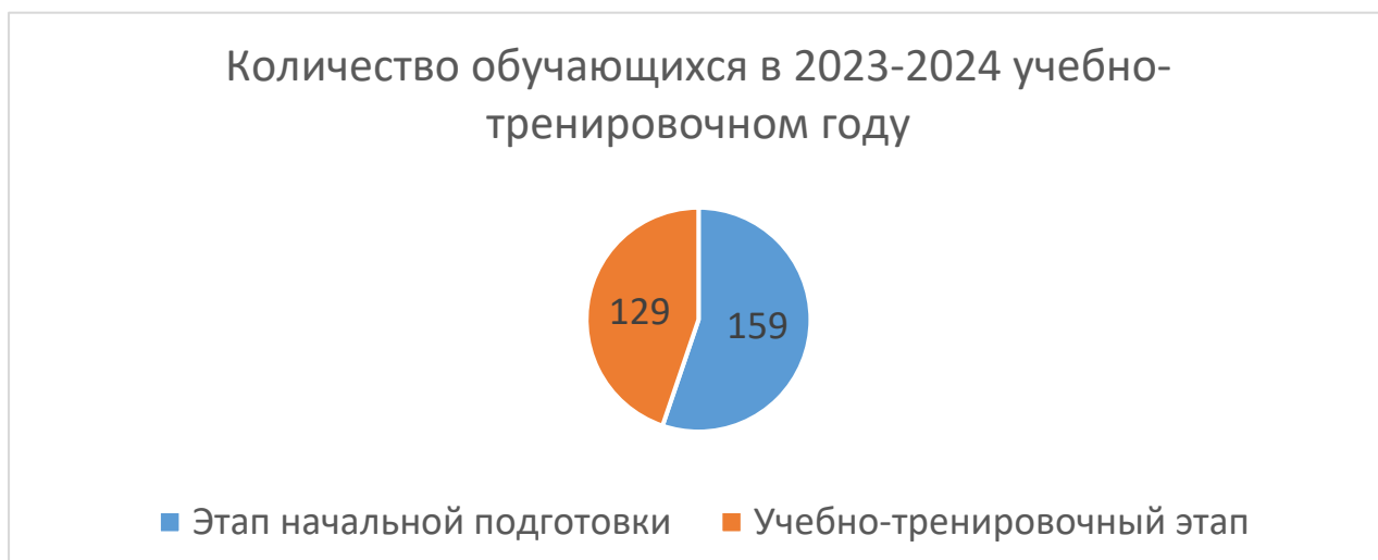
Рисунок 1 – Распределение обучающихся по этапам подготовки

При комплектовании учебно-тренировочных групп учитывались результаты индивидуального отбора обучающихся на обучение по дополнительным образовательным программам спортивной подготовки, полученные в ходе вступительных испытаний приемной комиссией организации. В МАУ ДО «СШ «Белогорец» обучаются дети от 7 до 18 лет.